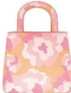
Minisac en cuir "Summer Malibu", Miyette , 169 €