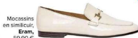
Mocassins en similicuir, Eram , 59,90 €