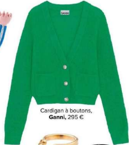
Cardigan à boutons, Ganni , 295 €