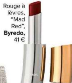
Rouge à lèvres, "Mad Red", Byredo , 41 €