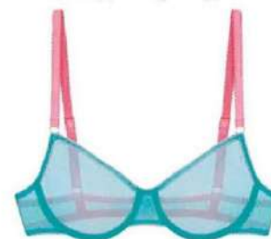
Ensemble en nylon recyclé, Dora Larsen , 63 € et 36 €