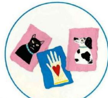
Set de 4 assiettes, "Happy Days", Fragonard , 45 €