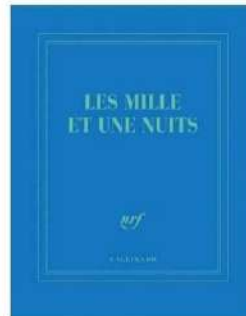
Carnet Les Mille et une nuits , papeterie Gallimard , 14,50 €