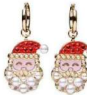
Boucles d'oreilles, Balabosté , 14,90 €, aux Galeries Lafayette