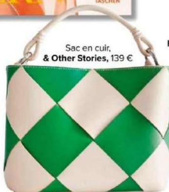
Sac en cuir, & Other Stories, 139 €