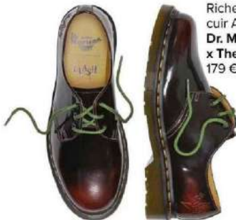
Richelieu en cuir Arcadia, Dr. Martens x The Clash , 179 €