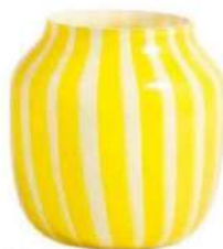
Vase "Juice" en verre, Hay chez Made In Design , 199 €