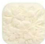
Savon parfumé "Etoile", 150 g, Fragonard , 7 €