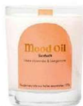
Bougie parfumée, 170 g "Sunbath", Mood Oil , 30 €