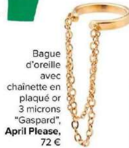
Bague d'oreille avec chaînette en plaqué or 3 microns "Gaspard", April Please , 72 €