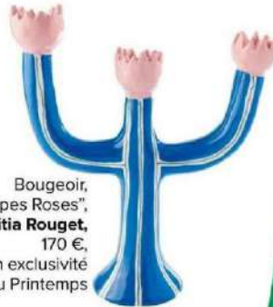
Bougeoir, "Tulipes Roses", Laetitia Rouget , 170 €, en exclusivité au Printemps