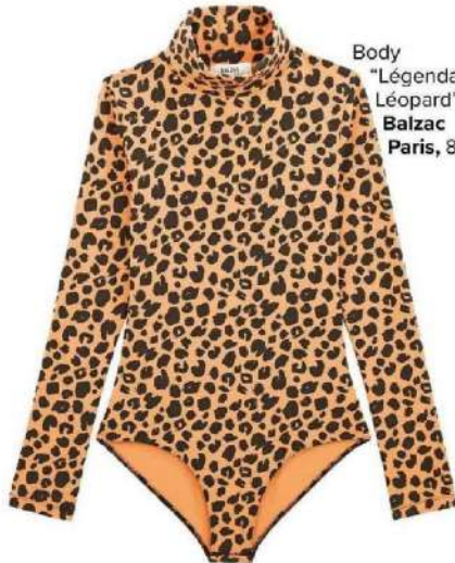
Body "Léoparde Léopard", Balzac Paris , 85 €