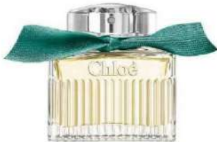
Eau de parfum "Rose naturelle intense", 50 ml, Chloé , 103 €