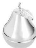
Bonbonnière en métal argenté, (H 5 cm), Christofle , 165 €