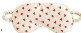
Masque de sommeil, Monki , 8 €