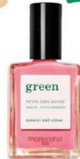
Vernis "Pink paradise", Manucurist , 14 €