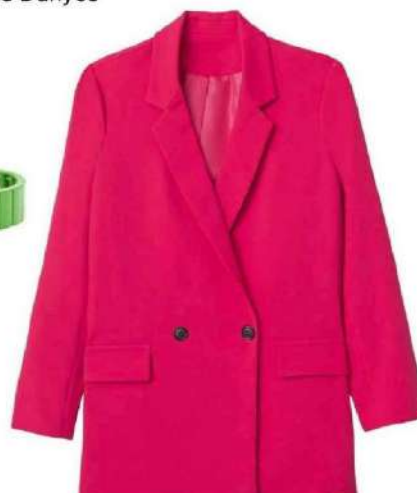
Blazer, Gémo , 34,99 €