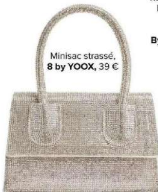
Minisac strassé, 8 by YOOX , 39 €