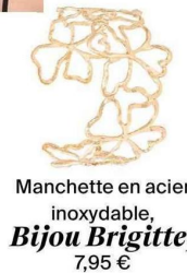
Manchette en acier inoxydable, Bijou Brigitte , 7,95 €