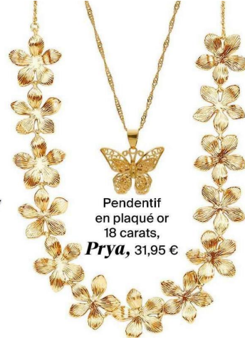
Pendentif en plaqué or 18 carats, Prya , 31,95 €