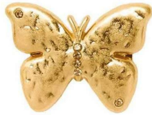
Broche en zinc et verre, Parfois , 7,99 €

Journaliste : Charlotte Draghi Nombre de mots : 138