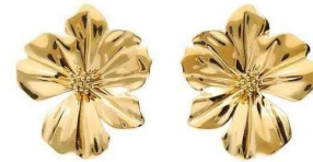
Boucles d'oreilles en acier inoxydable, My Jewellery , 22,99 €