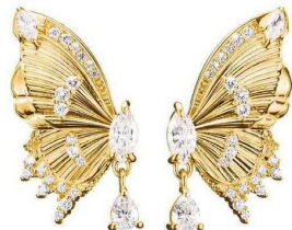
Boucles d'oreilles en argent sterling et plaqué or, Thomas Sabo , 229 €