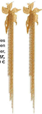
Boucles d'oreilles en zinc et acier, Pull & Bear , 15,99 €