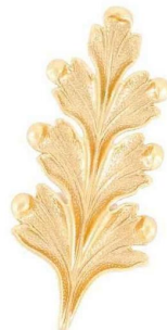
Broche en plaqué or jaune, Evesome , 40 €