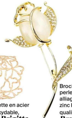
Broche en perle, strass, alliage zinc haute qualité, Broches Bijoux , 25,90 €