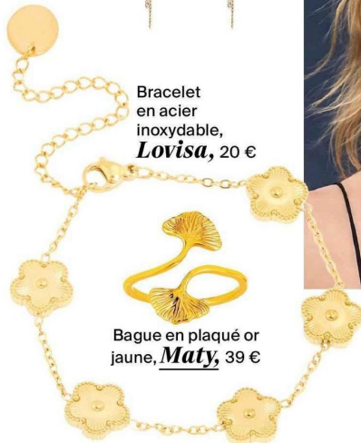
Bracelet en acier inoxydable, Lovisa , 20 €